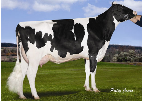
STANTONS OBSERVER EXTREME Dam